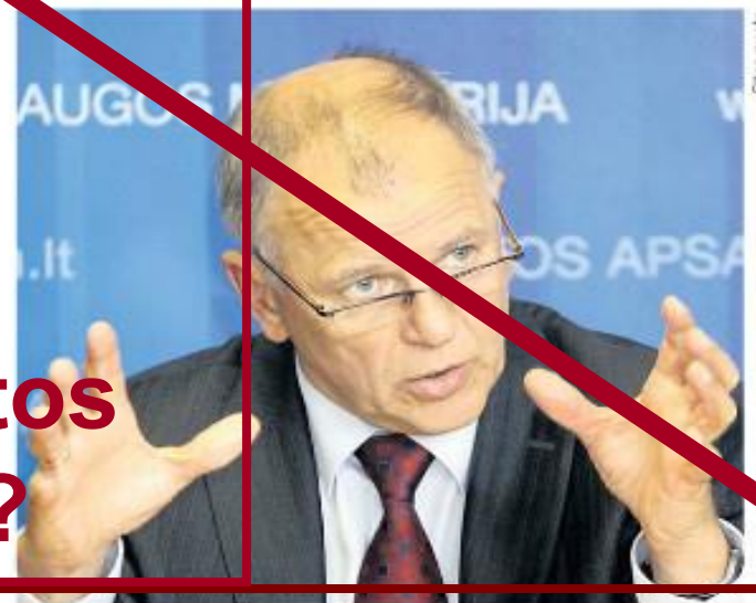
Lietuvos sveikatos apsaugos ministras V. P. Andriukaitis pareiškė viltį, kad generinių vaistų pramonė ir valstybės pareigūnai tęs konstruktyvų dialogą.

Generiniai vaistai padeda sumažinti išlaidas, už kuriuos reikia mažiau mokėti arčiau kainų mažinti.