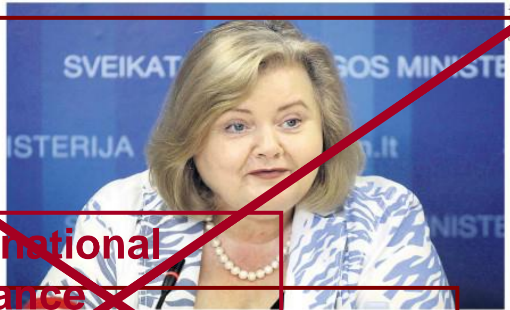
EGA prezidentė atsilavo, kalbėdama apie vaistų kainas svarbu išsiaiškinti vaistų asortimentą ir pasirinkimą.

Generiniai vaistai padeda sumažinti išlaidas, už kuriuos reikia mažiau mokėti arčiau kainų mažinti.