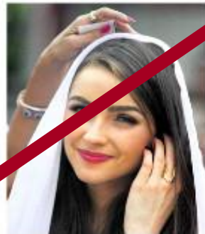
Indijos policija pateikė iškini „Mis visatos“ titulą laimėjusiai